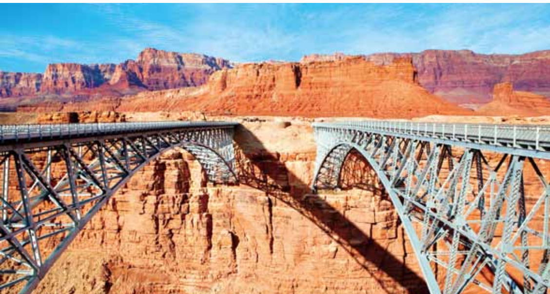
上/ウィリアムズからグランド・キャニオンまで毎日運行しているグランド・キャニオン鉄道。 下/コロラド川上流に架かるナバホ橋。左は旧橋、右は1995年に開通した新橋で、川からの高さは140mに及ぶ。

アメリカを代表する 一大絶景地帯 グランド・キャニオンの起源は、七〇〇万年前にこの地域一体が、「カイバブ・アツプリフト」と呼ばれる地殻変動によって隆起したことに始まる。その後、約四〇〇万年前からコロラド川によって少しずつ浸食され、約二〇〇万年前に現在のような見渡す限りの大峡谷が形成されたと考えられている。 コロラド川の激流は、今も