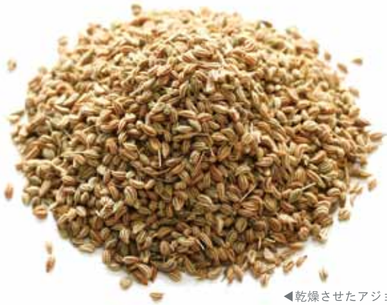
◀乾燥させたアジョワンの種子。

主 にインドで生産されるアジョワン。砕いた種子にはタイムに似た芳香があり、インド料理、特にカレーには欠かせないスパイスとして知られている。 また、アジョワンに含まれるチモールという成分には、強力な殺菌・防腐作用があり、インドの伝統医学アーユルヴェーダでも用いられる。アジョワンを一晩水に浸して作るアジョワン水は、消化不良や二日酔いに効果があるとされているほか、種子を蒸留して作られる精油は、防腐剤や歯磨き粉にも使われている。 このように、さまざまな用途で利用できることから、インドの家庭には必ずと言っていいほどアジョワンが常備されているという。