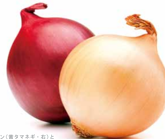
▶オニオン(黄タマネギ・右)と レッドオニオン(紫タマネギ・左)。