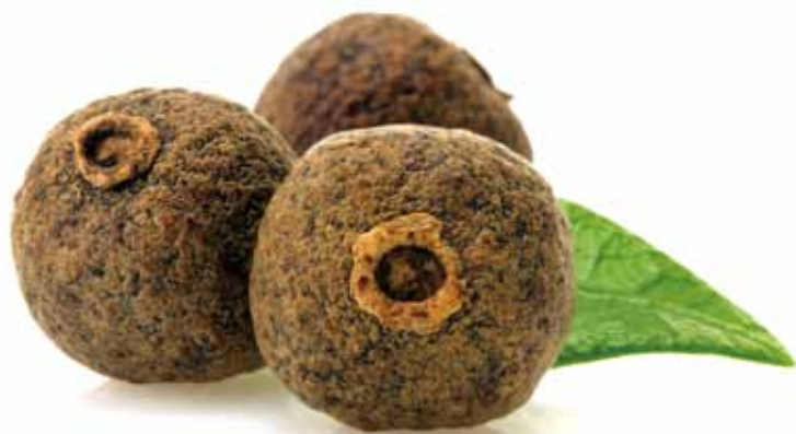
▲オールスパイス。乾燥させた果実をスパイスとして使う。

オ ールスパイスは、ヨーロッパが新大陸からヨーロッパに持ち込んだスパイスの一つ。名前はクローブ、ナツメグ、シナモンの三大スパイスを合わせたような風味に由来し、形や味がペッパー（コショウ）に似ていることから「ピャクミコシヨウ（百味胡椒）」「ジャマイカペッパー」などの別名を持つ。 一六五五年にイギリスがジャマイカを占領し、人工栽培によるオールスパイスの貿易を始める。一九世紀までに輸出量は約二〇倍にも増加。これに味をしめたイギリスは、ほかの熱帯植民地でも植樹を試みたが、失敗に終わった。そのため、現在もアメリカ大陸でしか栽培できない唯一のスパイスとなっている。