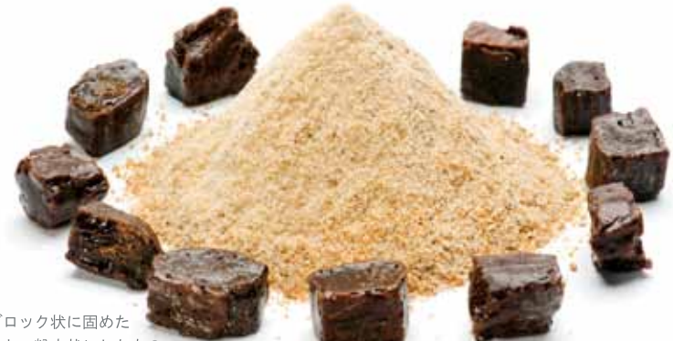
▶ブロック状に固めたものと、粉末状にしたもの。

南 西アジアや北アフリカを原産とするアサフェティダは、高さ二〜四メートルにもなるセリ科の植物だ。この根茎から採れるミルク状の樹脂を集め、乾燥させてブロックにしたものをスパイスや薬用として利用しており、現在は主に中東やインドで栽培されている。特に、インドの伝統医学アーユルヴェーダでは、神経衰弱やヒステリーに効果があるとして古くから処方されてきた。 ペルシャ語の「アザ(樹脂)」と、ラテン語の「フェティダ(臭い)」を合わせた名前通り、ニンニクやドリアンに似た強烈な臭気が最大の特徴。これは複数の硫黄化合物を含んでいるため、その臭いから「悪魔の糞」とも呼ばれる。