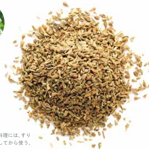
▶アニシード。料理には、すりつぶして粉末にしてから使う。