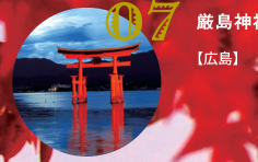
07 厳島神社 【広島】