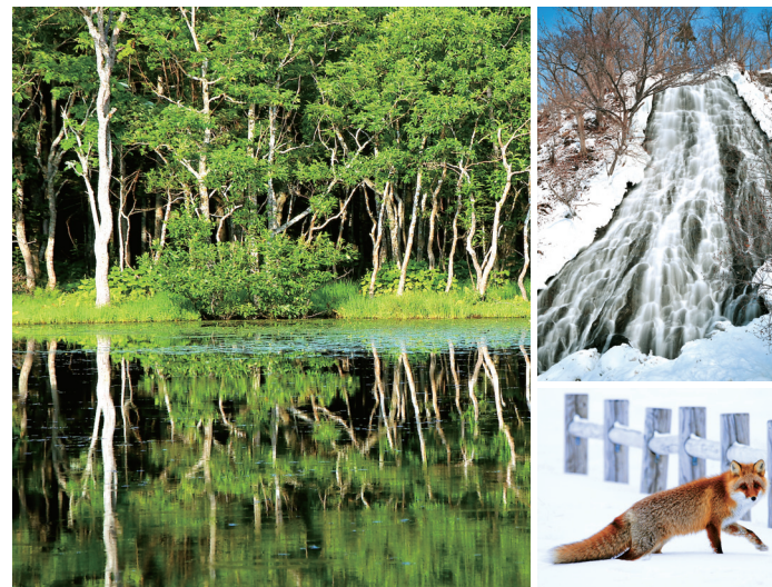
【右／上】約80mの落差をもつオシンコシンの滝。日本の滝百選にも選ばれており、滝の上の展望台からの眺めは絶景。【右／下】雪景色のなかを歩くかわいらしいキタキツネ。【左】原生林のなかに点在する知床五湖。知床八景の一つで人気があるが、ヒグマの生息地でもある。

北海道の東端に位置する知床半島は、豊かな生態系をはぐくむ日本屈指の自然地帯である。知床半島とその沿岸海域は、二〇〇五年に国内で三件目の自然遺産に登録された。