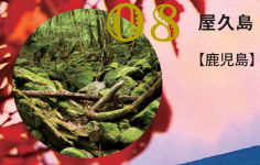
08 屋久島 【鹿児島】