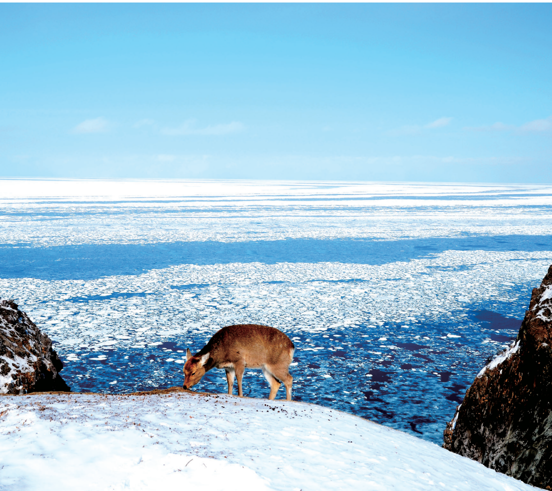
流氷に埋め尽くされた冬のオホーツク海と、北海道産のニホンジカであるエゾシカの子ども。