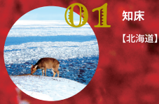
01 知床 【北海道】