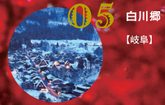
05 白川郷 【岐阜】

二〇一三年六月、 日本が世界に誇る 霊峰・富士山が 世界文化遺産に登録された。 これによって、 日本の世界遺産は 全一七件となった。 いにしえの歴史を 今に伝える遺構や、 四季折々の表情を見せる 美しい自然は、 私たちが暮らす この国の素晴らしさを 実感させてくれる。