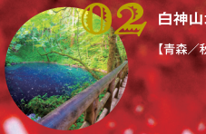
02 白神山 【青森／秋田】