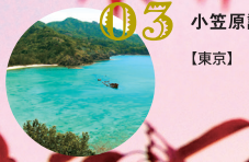
03 小笠原諸島 【東京】