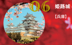
06 姫路城 【兵庫】