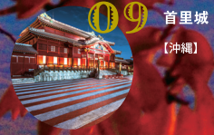
09 首里城 【沖縄】