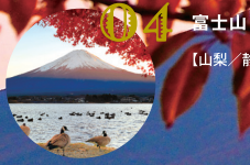
04 富士山 【山梨／静岡】