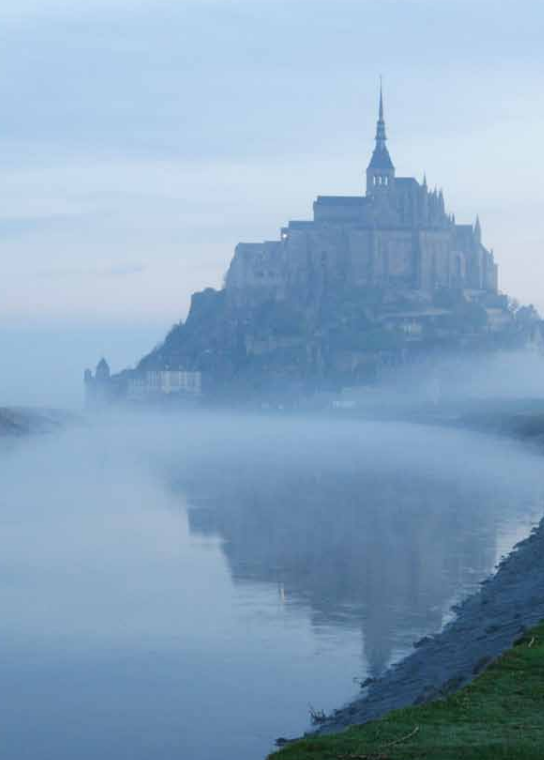
13 朝霧に包まれて幻想的な姿を見せるモン-サン-ミシェル。