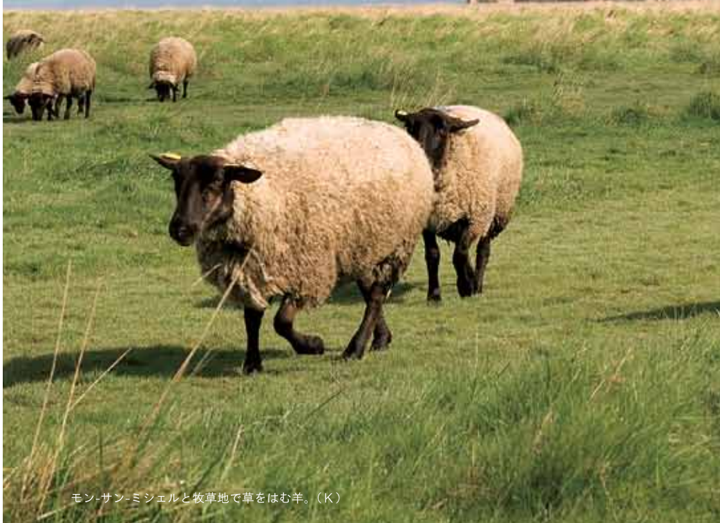
モン・サン・ミシェルと牧草地で草をはむ羊。(K)