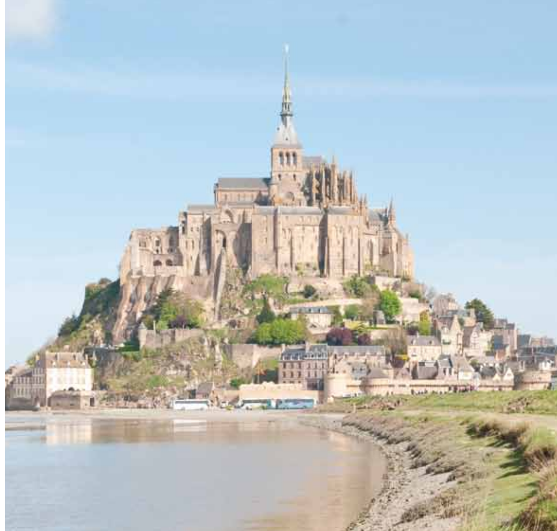
モンサンミシエルの全景。北面には3層から成るゴシック様式の傑作「ラ・メルヴェイユ」があり、塔の先端には聖ミカエルの黄金像が載る。

【上】モンサンミシエルの周囲に広がる干潟。【下】13世紀に完成した修道院の中庭と、ゴシック様式のアーチが美しい回廊。【左】かつて巡礼者が修道院へ向かった石畳の参道「グランド・リュ」。現在はレストランやホテル、土産物店が建ち並ぶ。