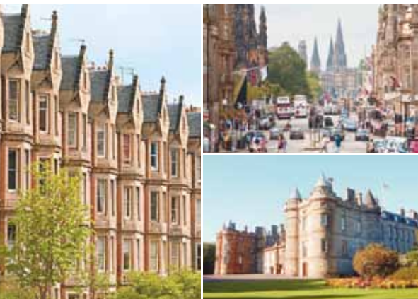
【左】華やかなヴィクトリア様式の建物が建ち並ぶ。 【上】新市街のメイン・ストリート「プリンセス・ストリート」。 【下】1128年にデイヴィッド1世によって建てられた寺院を前身とするホリールドハウス宮殿。