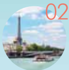
02 パリのセーヌ河岸 【フランス】