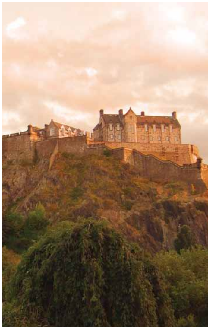
夕日に染まるエディンバラ城。