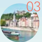
03 リヨン歴史地区 【フランス】