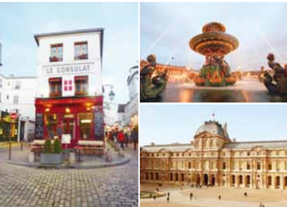
【左】セーヌ右岸に位置するモンマルトルには、雰囲気のあるカフェが多い。【上】マリー・アントワネットがギロチンで処刑されたコンコルド広場。【下】もともとは12世紀末に要塞として建てられたルーブル美術館。