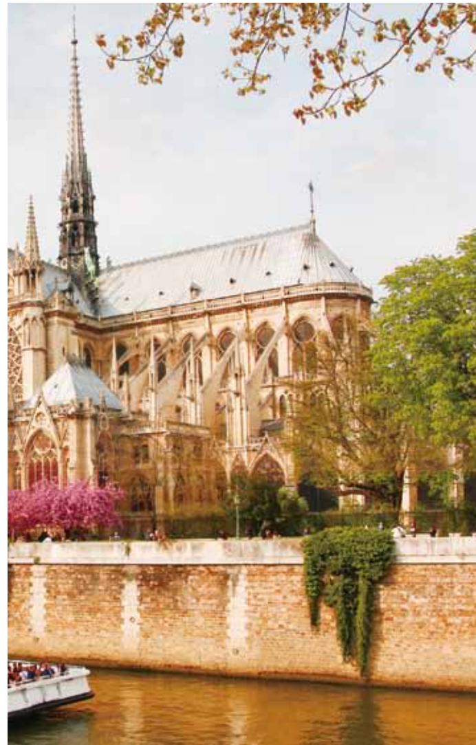
シテ島に建つノートルダム大聖堂。1163年に着工され、約200年もの年月を経て1345年に完成したゴシック建築の最高傑作。

中世と現代が交錯する世界屈指の観光都市 フランスの政治、経済、文化の中心を担う首都パリ。その起源は、紀元前四世紀にセーヌ川の中州であるシテ島につくられた集落から発達したと考えられている。 世界遺産に指定されているセーヌ河岸の地域には、ノートルダム大聖堂に代表される中世の建築物群と、エッフェル塔などの近・現代の建築物とが融合した美しい街並みがある。