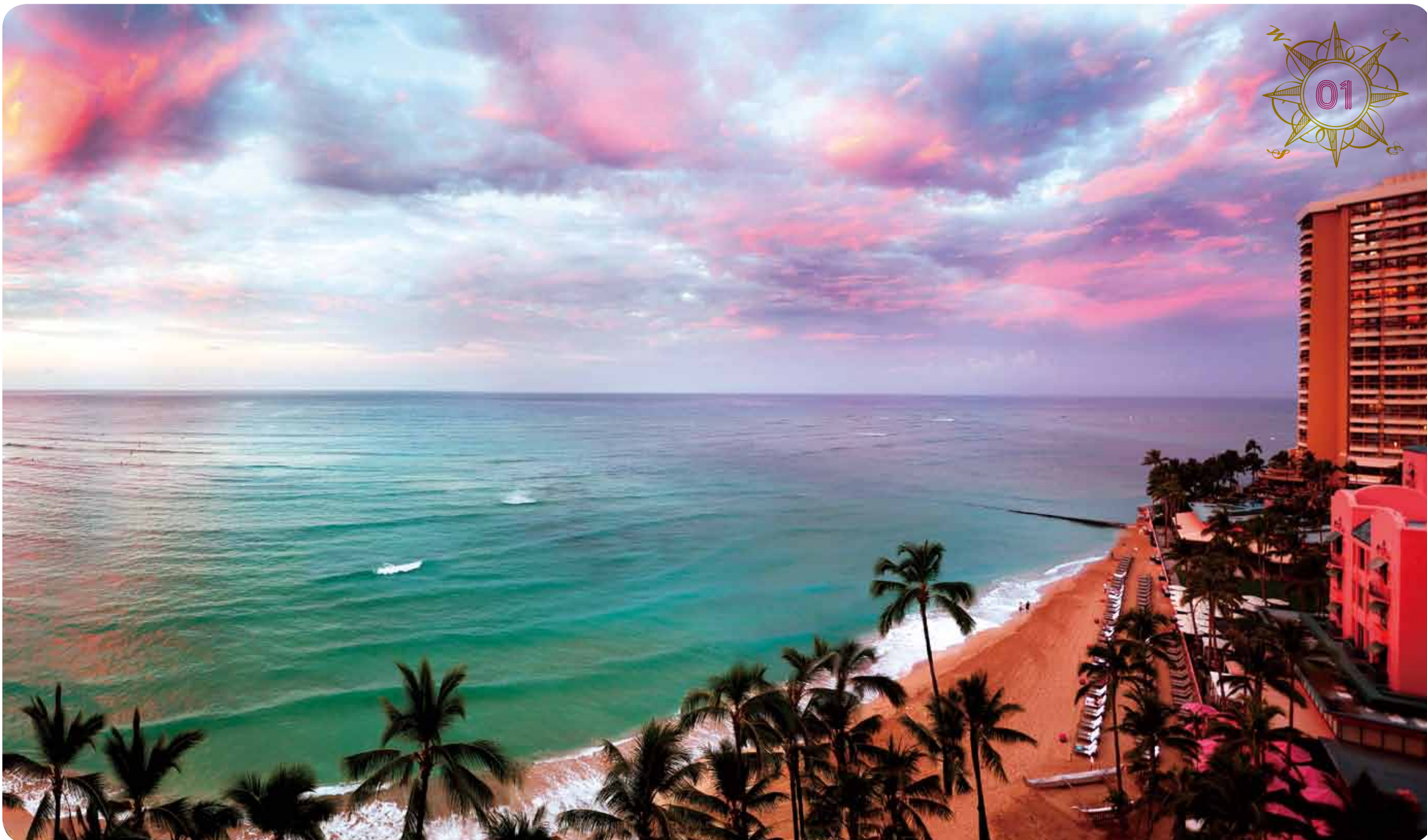
ハワイのリゾートの代名詞、ワイキキ・ビーチの夜明け。人工の砂浜で、定期的に砂が補充されている。