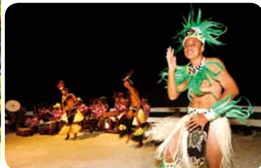
【左】タヒチ島最北端、島で唯一のヴィーナス岬の灯台。ヨーロッパの探検家が初めて上陸した歴史的な場所としても知られる。【右上】タヒチ島北西部に位置するマタバイ湾の夕暮れ。【右下】タヒチアンダンスを踊る人々。現地では「オリ（踊りの意）・タヒチ」と呼ばれ、文字文化がなかったころは、重要なコミュニケーションの手段の一つとして使われていた。