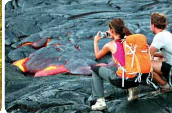
【上】ハワイの民族舞踊、フラダンスを踊る少女。もともとは、先住民の宗教的な儀式の際に演じられていた。【左】モロカイ島のカヒワ滝。その落差は約650mで、ハワイ最大。【右/上】マウイ島東部にあるコキ・ビーチ。サーフィン・スポットとして知られ、ビーチからはアラウ島という美しい小島を望める。【右/下】ハワイ島の活火山、キラウエア火山。溶岩を間近で見られるツアーは大人気だ。