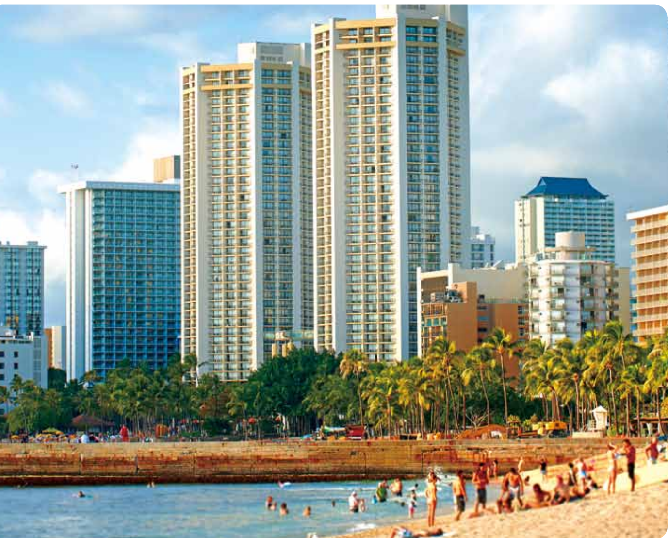
季節を問わず多くの観光客でにぎわうワイキキ・ビーチ。ハワイ王国時代は王族の保養地だったが、現在はメインストリートであるカラカウア通りやクヒオ通りを中心に、リゾートホテルやコンドミニアム、ショッピングセンターや飲食店などが立ち並んでいて、ホノルルきってのリゾートエリアとなっている。