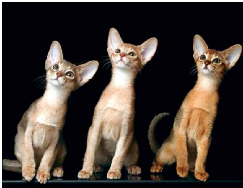
【上】珍しいシルバーカラーのアビシニアン。【下】大きな耳が愛らしい、アビシニアンの子ネコ。子ネコは寒さにやや弱いため、冬場は毛布などを用意して保温してあげるとよい。