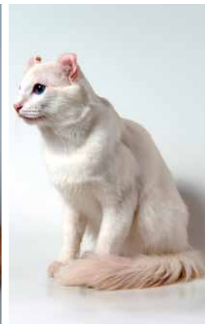
【上】ロングヘアのアメリカンカール。長毛種の場合は朝と晩1回ずつブラッシングしてあげるとよい。 【下左】さまざまな毛色が認められている。【下右】ショートヘアのアメリカンカール。