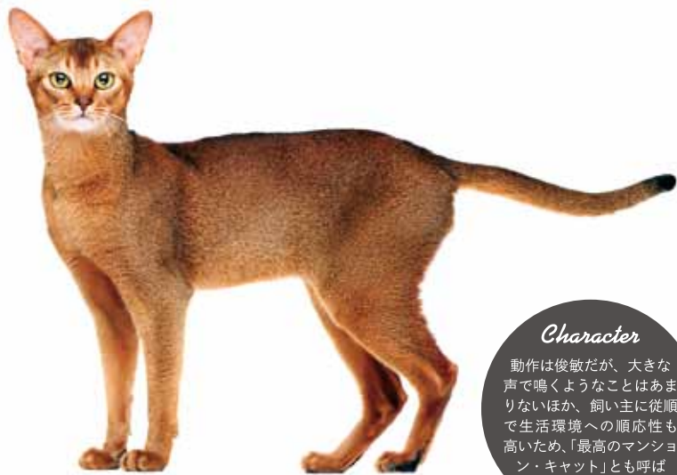
しなやかな体つきのアビシニアン。

毛の種類 中くらいの短毛種 毛の色 ルディ（深みのある茶色）、レッド（シモン）、ブルー、フォーン、シルバー 目の色 ゴールド、グリーン、ヘーゼル