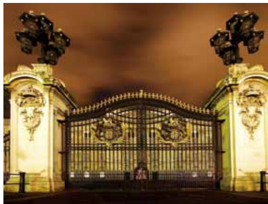
上／「ベアスキン」と呼ばれる独特の帽子をかぶり、行進する近衛歩兵部隊。下左／市街地とバッキンガム宮殿をつなぐアドミラルティ・アーチ。下右／威厳を感じさせる宮殿の門。

ロンドンの中心に位置するバッキンガム宮殿は、イギリス王室の住居であると共に、王室の記念式典や祝賀会などが行われる王室庁本部でもある。その始まりは1703年、バッキンガム公爵ジョン・シェフィールドが自らの邸宅用に購入した桑畑に建てたれんが造りの邸宅、「バッキンガム・ハウス」だといわれている。