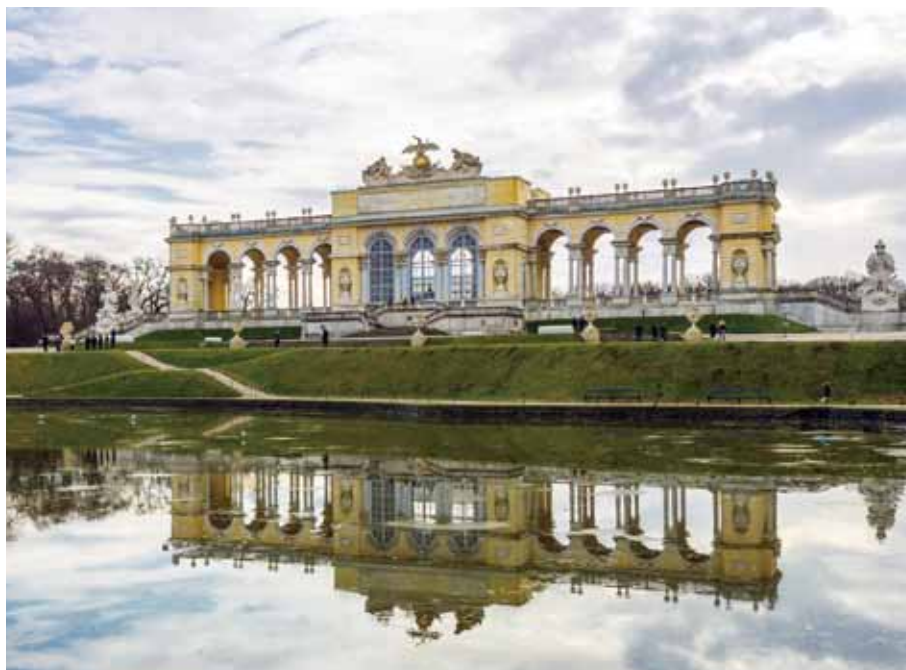
宮殿と向かい合うように建つ未完の記念碑、グロリエッテ。

ウィーン近郊に建つシェーンブルン宮殿。かつてハプスブルク家の獵場であったこの地に、宮殿の建設が始まったのは1693年のことで、「ヴェルサイユを凌ぐ宮殿を」というレオポルト1世の命により着工され、1713年に完成した。その後も改築や増築が繰り返され、ウィーン風ロココ様式の宮殿へとその姿を変え、今に至っている。当初はピンクだった外壁を、シェーンブルン宮殿の代名詞ともいえる黄色に塗り替えたのは、ハプスブルク家唯一の女帝で最大の権力を誇ったマリア・テレジア。1740年に23歳の若さで即位すると、際立った政治手腕で帝国に繁栄と安定をもたらした。この宮殿を住居と決めた彼女は、財政状況に配慮して金に近い黄色で外壁を塗ったといい、今ではこの色が「テレジア・イエロー」と称されている。