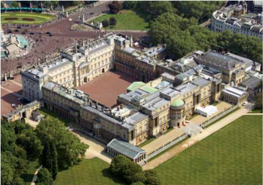
上/セント・ジェームズ公園とペリカン。下/バッキンガム宮殿全景。手前には芝の庭園が広がっている。

バッキンガム宮殿のすぐ側にあるセント・ジェームズ公園は、ロンドンの公園のなかでも最も古い歴史を持つ。公園の中心にあるセント・ジェームズ湖にいる名物のペリカンは、1664年にロシア大使から贈呈されたつがい起源だといふ。手入れの行き届いた公園には季節の花が咲き、ロンドンの中心にいることを忘れてしまうような自然が広がっている。