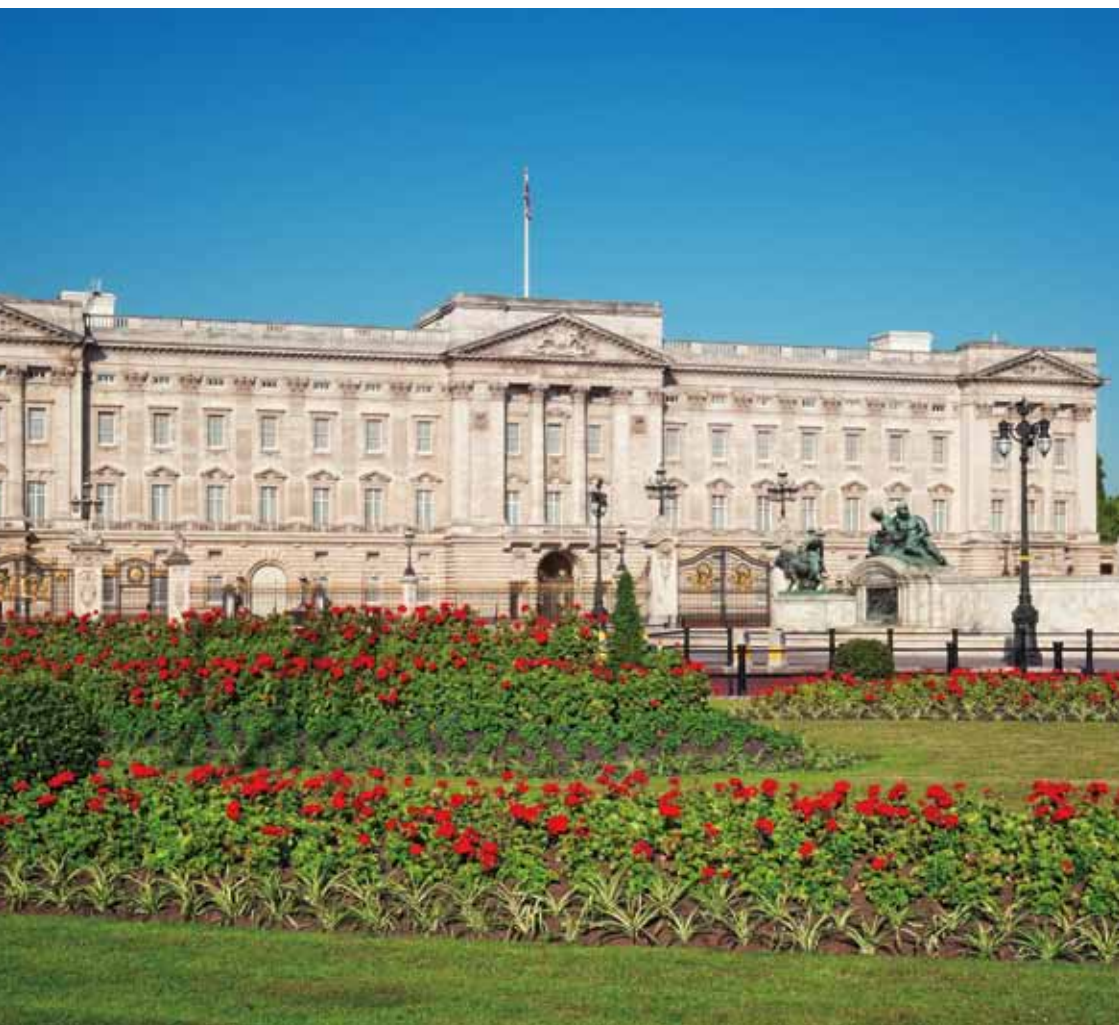
バッキンガム宮殿全景。手前には美しい庭が広がっている。

ロンドンで最も有名な観光名所の一つであるバッキンガム宮殿。現在もイギリス王室の公式な住居であると共に、公務を執り行う場所でもある世界でも珍しい現役の宮殿だ。