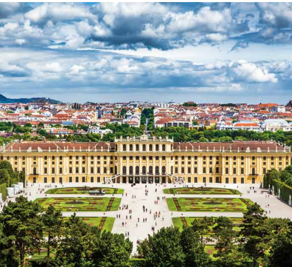
シェーンブルン宮殿全景(写真：canadastock / Shutterstock.com)。

オーストリアの首都ウィーン郊外、ウィーンの森に接して建つ宮殿。名門ハプスブルク家の栄華を今に伝えるバロック様式の宮殿で、1996年に世界遺産に登録された。