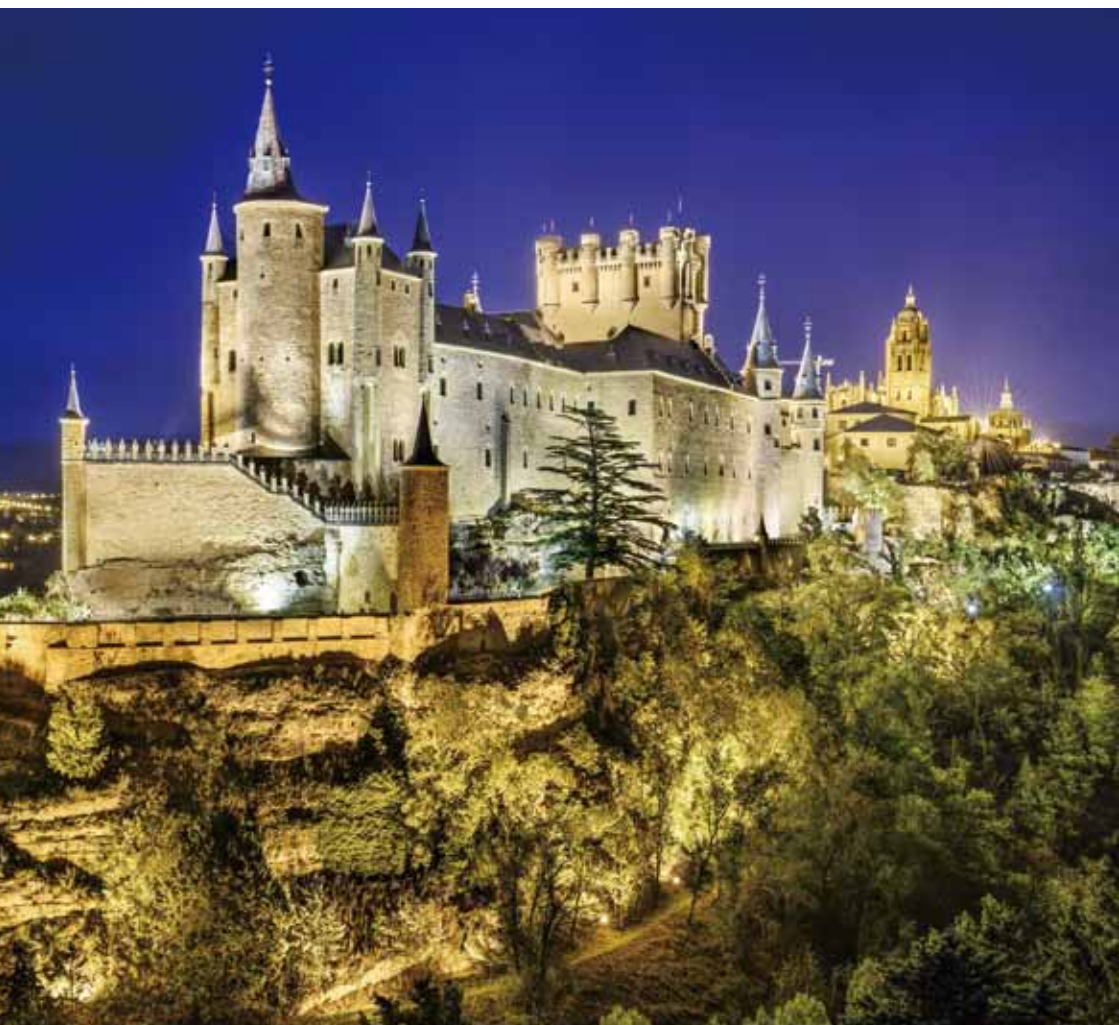
ライトアップされた夜のセゴビアのアルカサル。

セゴビアは、スペイン北部のカスティーリャ・イ・レオン州の街。旧市街の外れに建つアルカサルは、1985年に「セゴビア旧市街とローマ水道橋」の一部として、世界遺産に登録された。