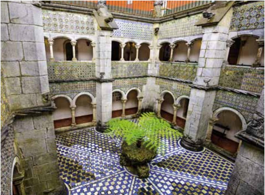
空間を四角く切り取ったような中庭。

ペーナ宮殿が建てられたのは1836年のこと。ポルトガル王フェルナンド2世がシントラの山頂に残る修道院の廃墟を買い取り、夏の離宮として建設を始めた。王はロマン主義的嗜好を持っていたとされ、異国の木々を集めたイギリス式庭園や、パステルカラーの外壁、トロンプ・ルイユ(騙し絵)が施された壁などにその趣向が感じ取れる。