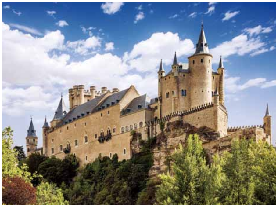
ディズニー映画「白雪姫」に登場する城のモデルとしても有名。

マドリード北西約90キロのグアダラマ山脈の麓に位置するセゴビア。その旧市街北端、エレマス川とクラモレス川に挟まれた高さ約100メートルの断崖上に築かれたアルカサルは、レコンキスタ(国土回復運動)時代に建造された歴代カステイリヤ王の居城であり、重要な軍事拠点としての役割も担っていた。城の起源は、古代ローマ時代に築かれた要塞。優れた立地条件からとりでとして使用され、12〜13世紀にかけて現在のゴシック様式の建物が完成した。この気品ある姿から「カテドラルの貴婦人」とも称されている。 1862年に火事で大きな被害を受けたが、1882年に修復。以前は軍事拠点のイメージが強かったが、1898年に軍事資料館として公開され、1951年にはアルカサル財団が設立。その歴史的価値が見直された。