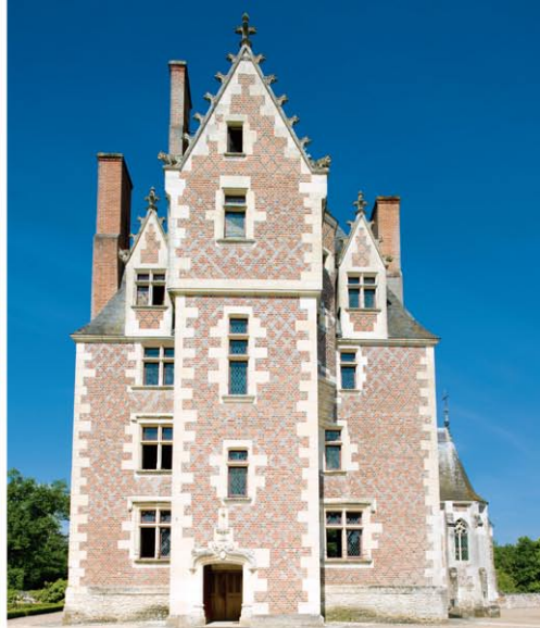
【右】白いレンガの縁取りがかわいらしい。【左上】堀の対岸からムーラン城を望む。【左下】庭園内に建つ庭師の家。城館同様、こちらもおとぎ話のような雰囲気をつたえている。