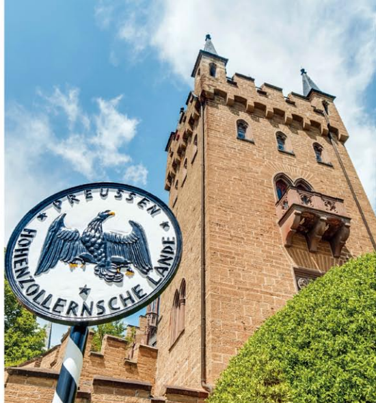
【右】敷地内には、プロイセン王国の紋章に用いられるワシを描いた看板が立てられている。【左上】華やかなシャンデリアや大理石の列柱が並ぶ「伯爵の大広間」。【左下】城の周囲に並ぶ、歴代皇帝の銅像。