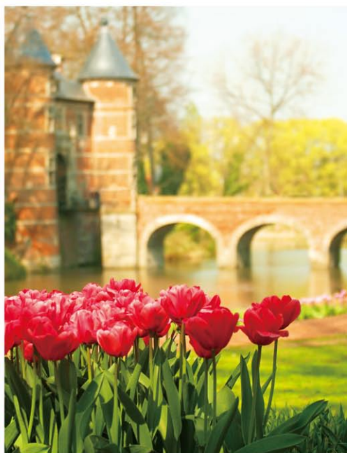
【右】城内で咲き誇る、ピンク色が鮮やかなチューリップ。【左上】中世の趣を今に残すグラン・ビガール城(写真: Vera Kalyuzhnaya / Shutterstock.com)。【左下】カラフルな花のじゅうたんが広がるグラン・ビガール城の庭園(写真: Vera Kalyuzhnaya / Shutterstock.com)。