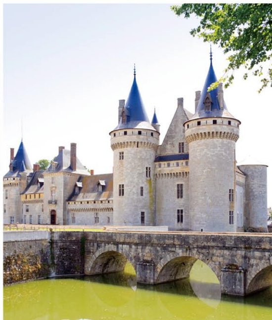
【右】堀に架かる橋と城。【左上】正面から望むシュリー・シュル・ロワール城。【左下】たっぷりの水が張られた堀の中に直接築かれている。