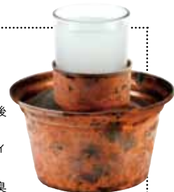
▲トルコの蒸留酒「ラク」