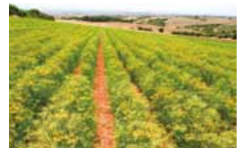
ギリシャのアニス畑