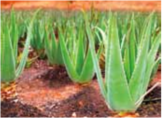
スペイン・カナリア諸島のアロエベラ畑