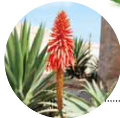
◀キダチアロエの花