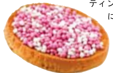
◀「マウシェ」。女の子はピンク、男の子は青のアニシードを載せる

◀アニシード入りのアーモンド・ビスコッティ。イタリアの焼き菓子で、コーヒーや紅茶にぴったり