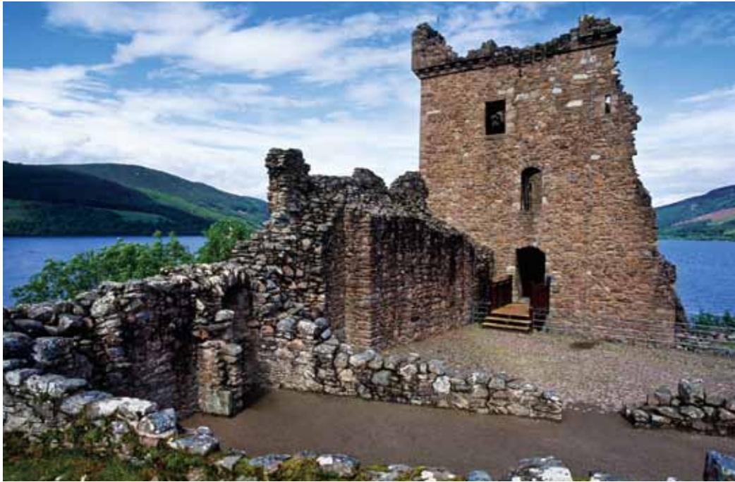
かつて栄華を誇った堅牢な城も、今は廃墟と化している。