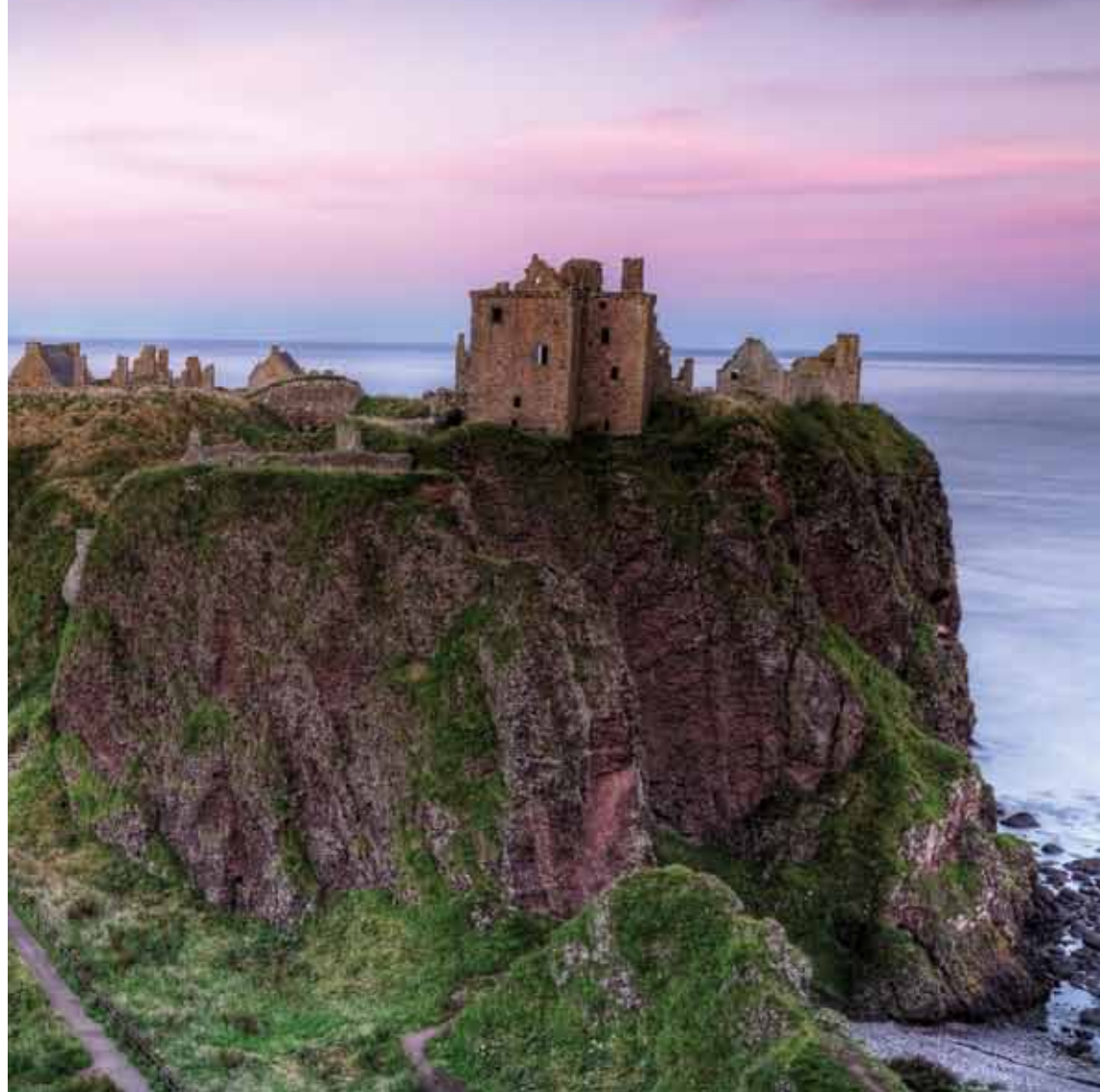
夕暮れ時のダノター城。廃城となっているが、観光客が立ち入ることはできる。