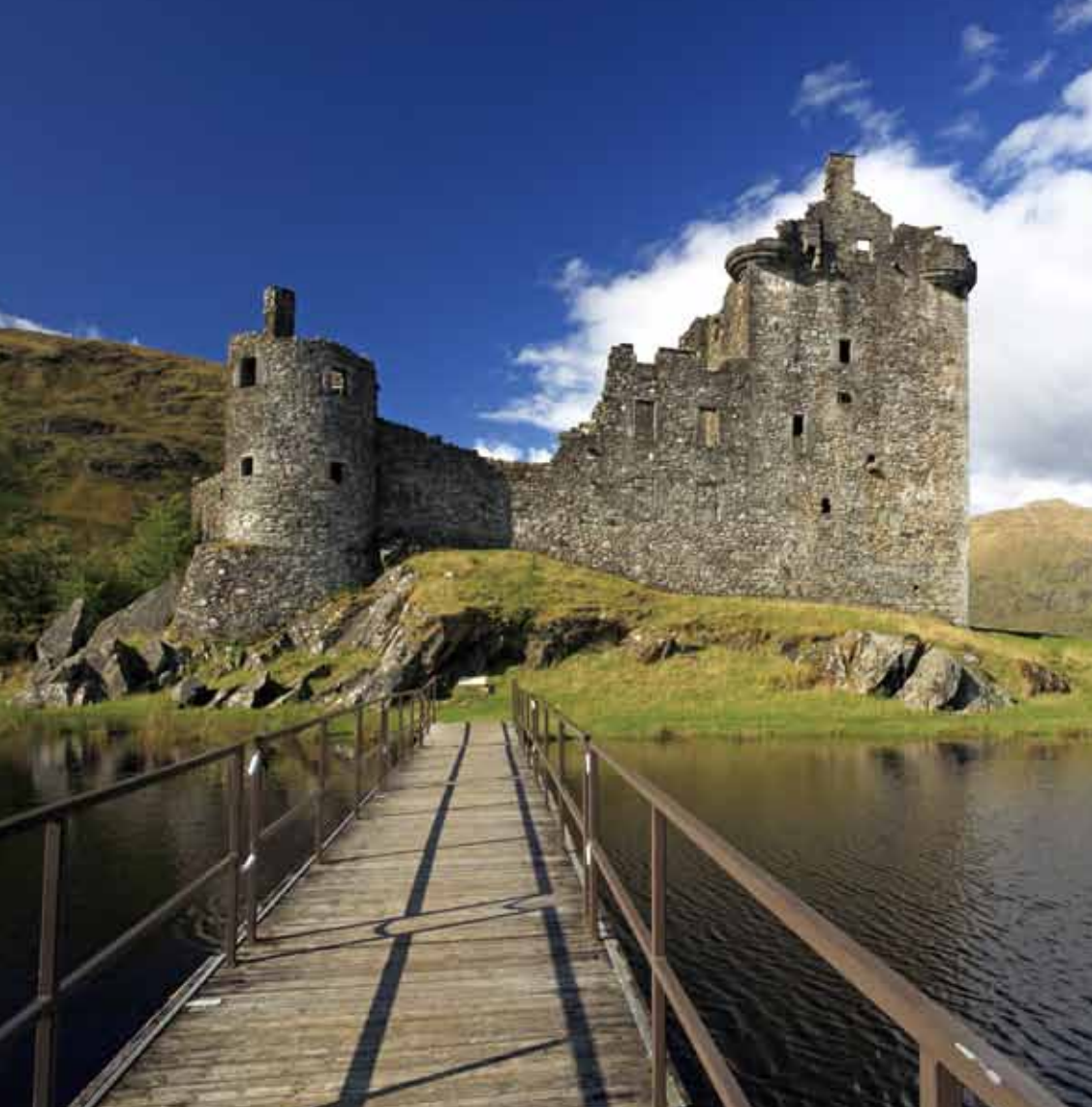
キルカーン城が建つ小島には、橋が架けられている。