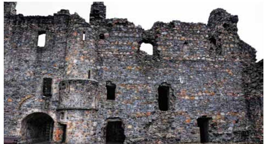
上/オー湖に建つ廃城。下/今は歴史遺産を保護・管理する団体「ヒストリック・スコットランド」の管理下にある。