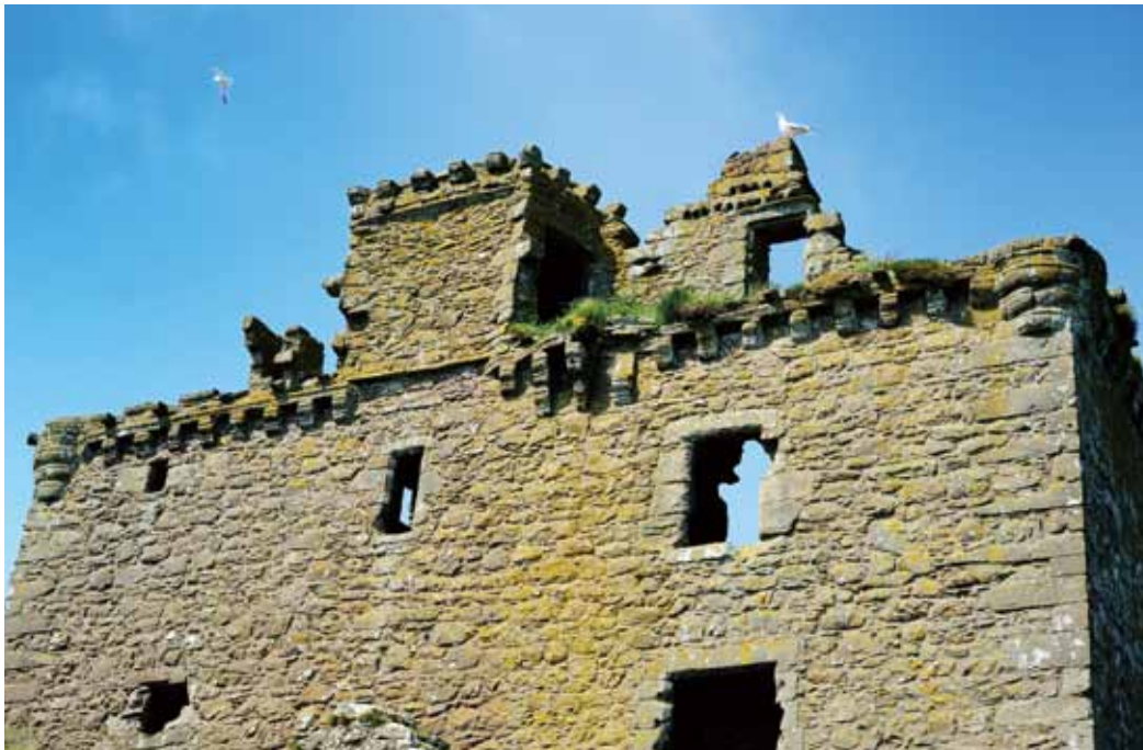
上／荒廃が進み天井が抜け落ちている。下／ダノター城の「dun」は、ピクト語で「岩」を意味する。