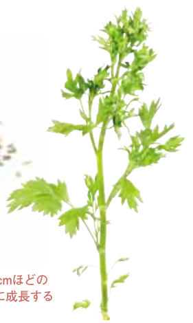
▶50cmほどの高さに成長する