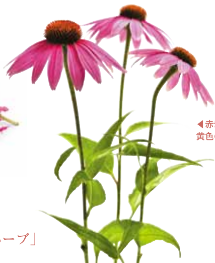
◀赤紫色のほか、白や黄色の園芸品種もある