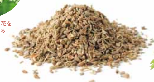
▼種子のように見える果実(アニシード)