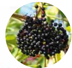
▲熟した果実は食用に