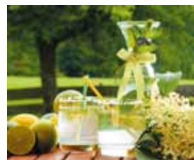
▲エルダーの花で作るシロップとジュースは、ヨーロッパではおなじみ

乾燥したエルダーフラワー(小さじ1)をポットに入れて熱湯を注ぎ、フタをして2~3分蒸らす。香りをかぐようにして飲むとよい。