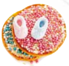
◀オランダの「マウシエ」。女の子はピンク、男の子は青のアニシードを載せる