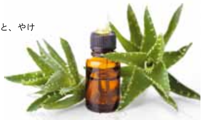
▲アロエエキスは小瓶に入れて保存しておく

細かく刻んだアロエの生葉、または乾燥させた葉を木綿の袋に入れてお湯に入れてから入浴すると、血行が良くなり、体を芯から温めてくれるので、湯冷めを防ぐ効果がある。