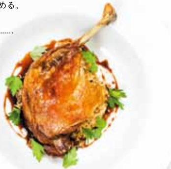
▲アニシードとイチジクのソースをかけた鴨肉のロースト

アニスの香味は空気に触れると変わりやすく、すりつぶすと直後から風味を失い始めるため、アニシードをそのまま保存しておき、使う分だけをすりつぶして使うのが一般的(葉や茎はそのままサラダやスープに使う)。アニシードをケーキやパンなどに混ぜて焼くと甘い香りが付くほか、ジャムや肉料理に使うソースに混ぜてもおいしい。オランダでは、赤ちゃんが生まれると、チョコレートでコーティングしたアニシードをビスケットに載せたお菓子「マウシエ」を客にふるまう習慣がある。