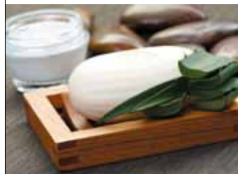
▲アロエの葉肉を使った石けんとクリーム

石けんとして トゲを落としたアロエの葉をミキサーで混ぜたものや、乾燥させた葉の粉末などを加えた手作り石けんは、美肌効果抜群。