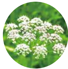
▲小さな白い花をたくさん付ける