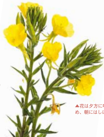
▲花は夕方咲き始 め、朝にはしぼむ

北 アメリカ原産の生命力の強い植物で、路地や荒地など、至る所で旺盛に繁殖する。かつてアメリカ先住民は、葉や根を食用にしたほか、まるごとすりつぶして肌に塗り、傷口や皮膚炎の治療に利用したといわれている。一七世紀以降にヨーロッパに伝わると、その薬効が認められ、イブニングプリムローズは「王様の万能薬」として重宝されるようになった。 葉や茎、根を乾燥させてハーブティーとして手軽に利用できるほか、種子から採れるオイルには、必須脂肪酸の一つであるガンマリノール酸が含まれており、月経前症候群(PMS)や更年期障害の症状の改善、血圧を下げるといった効果が期待されている。