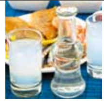
▶アニスで香り付けたギリシャのリキュール「ウーヅ」