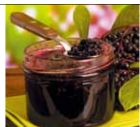
▲エルダーの果実のジャム

吊るしたほか、花を布袋に入れて身に付けていたという。薬効としては、よく知られている風邪やインフルエンザの症状を鎮めるだけでなく、シミやそばかすの軽減、花粉症による目の充血・鼻水の改善など、多岐にわたる。防虫効果も認められており、かつてイギリスでは虫よけのためにトイレのそばに植えられていたなど、まさに万能の名にふさわしいハーブだ。