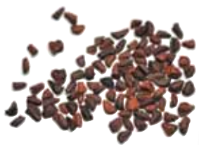
▲成熟した種子から オイルを採取する