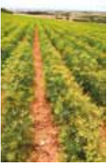
▶ギリシャのアニス畑