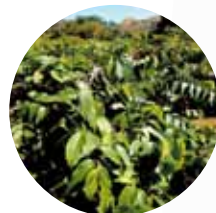
▲マダガスカルイランイラン畑

Ylang-ylang 和名：イランイランノキ 学名：Cananga odorata