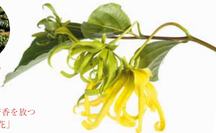
▲先が丸まった花びらが特徴