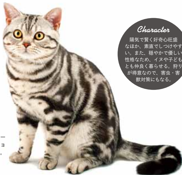
シルバークラシックタビーの被毛は、アメリカンショートヘアを代表する毛色。