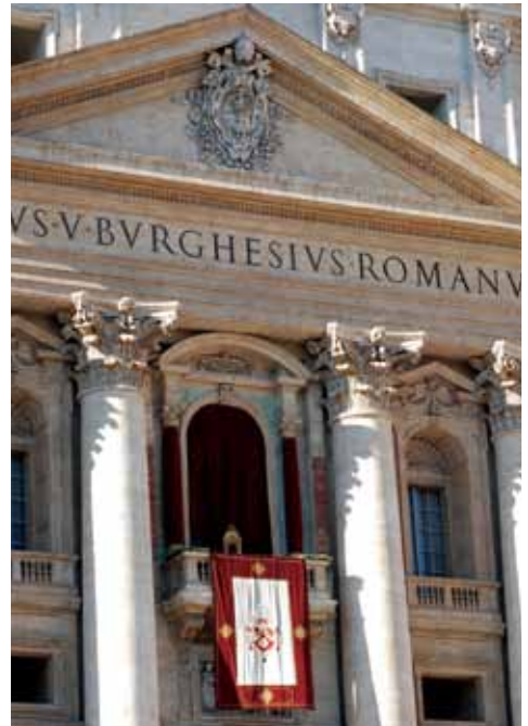
[右]ローマ教皇が演説などを行うバルコニー。[左]サン・ピエトロ広場から見た大聖堂の正面。